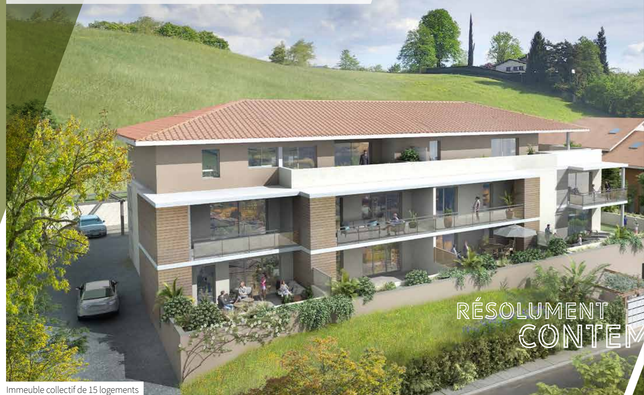
Immeuble collectif de 15 logements

À Saint-Marcellin, le Clos Arthur est idéalement situé à 500 m du centre-ville. Un emplacement de choix pour qui recherche un lieu de résidence au calme. À proximité de toutes les commodités, dans une ville réputée pour sa riche histoire.